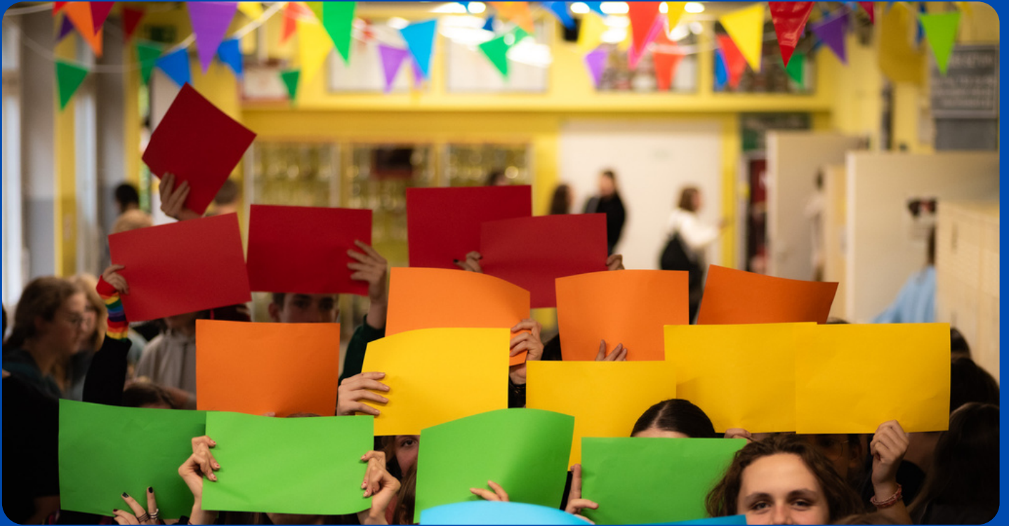
Rainbow Friday celebration initiated in 2023 by GrowSPACE Foundation