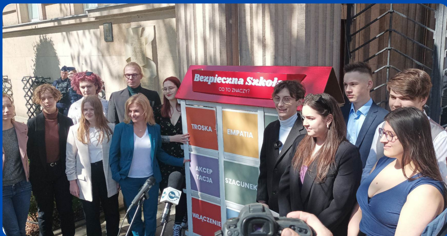
Announcement of the results of the Ranking of LGBTQ+ Friendly Schools 2023

Ogłoszenie wyników Rankingu Szkół Przyjaznych LGBTQ+ 2022