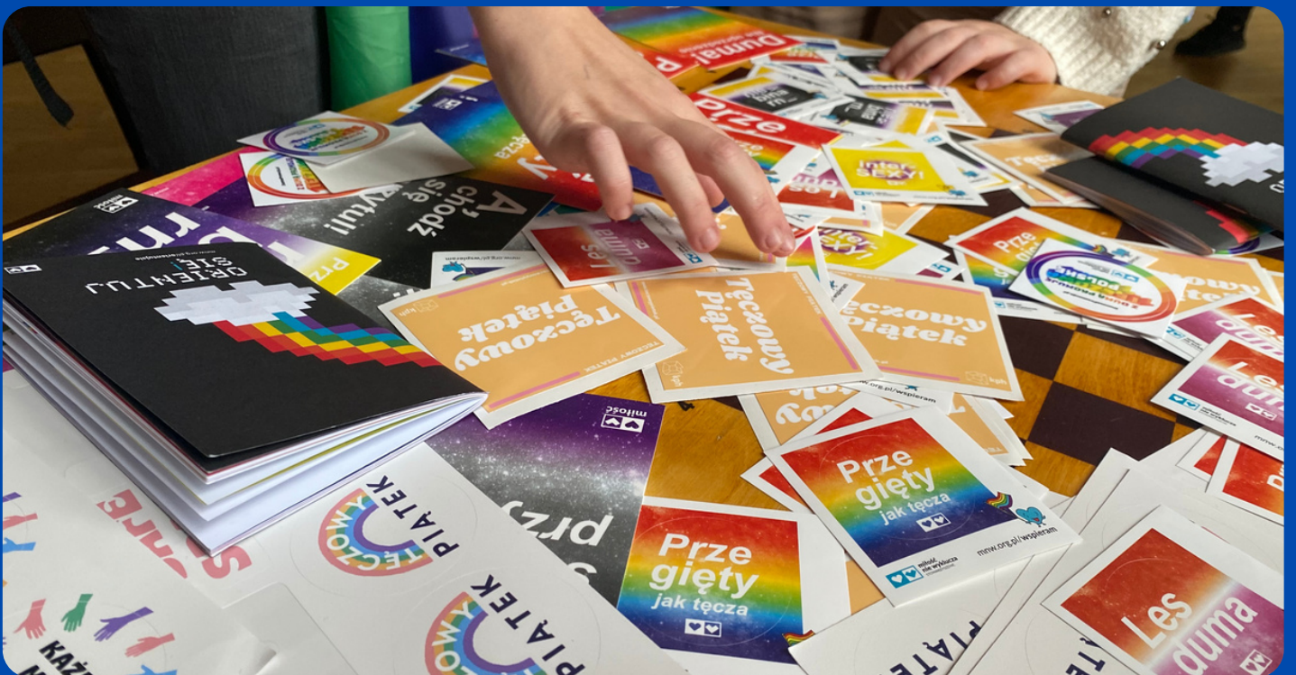
Obchody Tęczowego Piątku zainicjowane w 2023 roku przez Fundację GrowSPACE