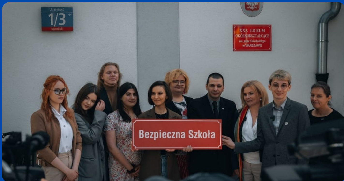
Announcement of the results of the Ranking of LGBTQ+ Friendly Schools 2022

Ogłoszenie wyników Rankingu Szkół Przyjaznych LGBTQ+ 2022